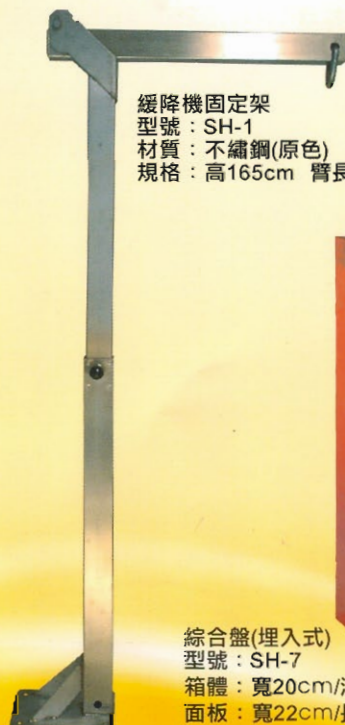
緩降機固定架 型號：SH-1 材質：不繡鋼(原色) 規格：高165cm 臂長60cm