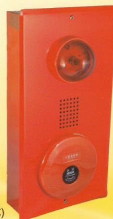
綜合盤(埋入式) 型號：SH-7 箱體：寬20cm/深7.5cm/長40cm 面板：寬22cm/長42cm