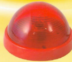
標示燈-鎢絲燈泡 型號：SH-FSL 規格：DC24V 0.11A