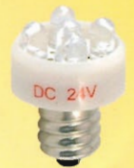
LED燈泡 型號：SH-8 規格：DC24V