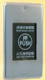
排煙手動開關 型號：SH-48 規格：DC24V 100mA