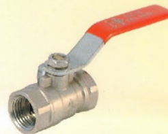
考克 規格：1" 1/2"