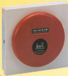
排煙手動啟動裝置 型號：SH-47(鐵殼烤漆) 規格尺寸：長17cm/寬6cm/高17cm