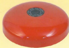
警鈴6" 型號：CT-FE 規格：DC24V 30mA