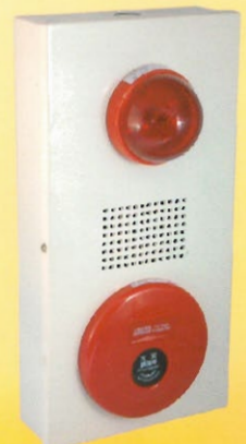
綜合盤(掛壁式) 型號：SH-6A 箱體：寬20cm/深7.5cm/長40cm