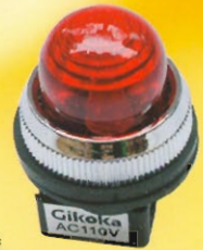
泵浦燈 規格：30mm/110V/220V/24V 25mm/110V/220V/24V