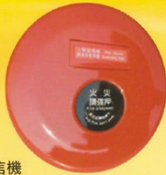
火警發信機 型號：SH-MSD 規格：DC24V 100mA