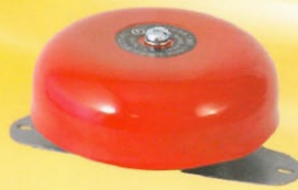
警鈴4" 型號：CT-FE 規格：DC24V 30mA