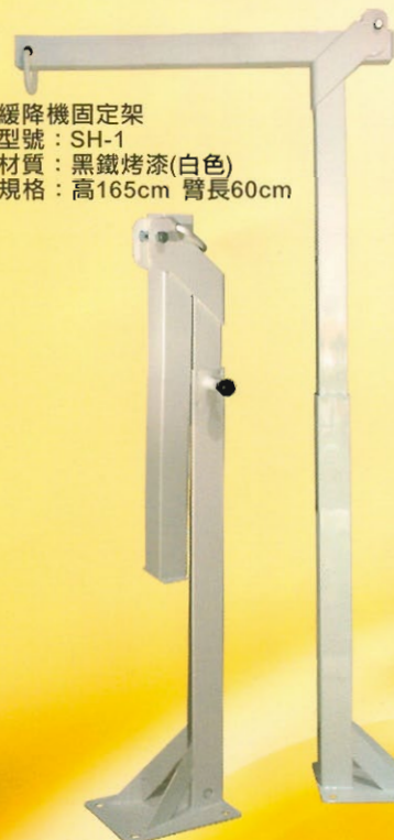
緩降機固定架 型號：SH-1 材質：黑鐵烤漆(白色) 規格：高165cm 臂長60cm