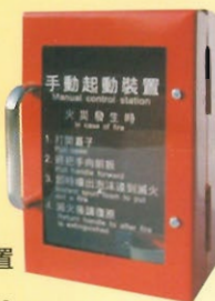
手動啟動裝置 型號：SH-5 規格：高14.9cm 寬9.9cm 深5.9cm