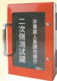
二次側測試閥 型號：SH-3 規格：高14.9cm 寬9.9cm 深5.9cm