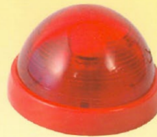
標示燈-LED燈泡 型號：SH-FSL-A 規格：DC24V 0.016A