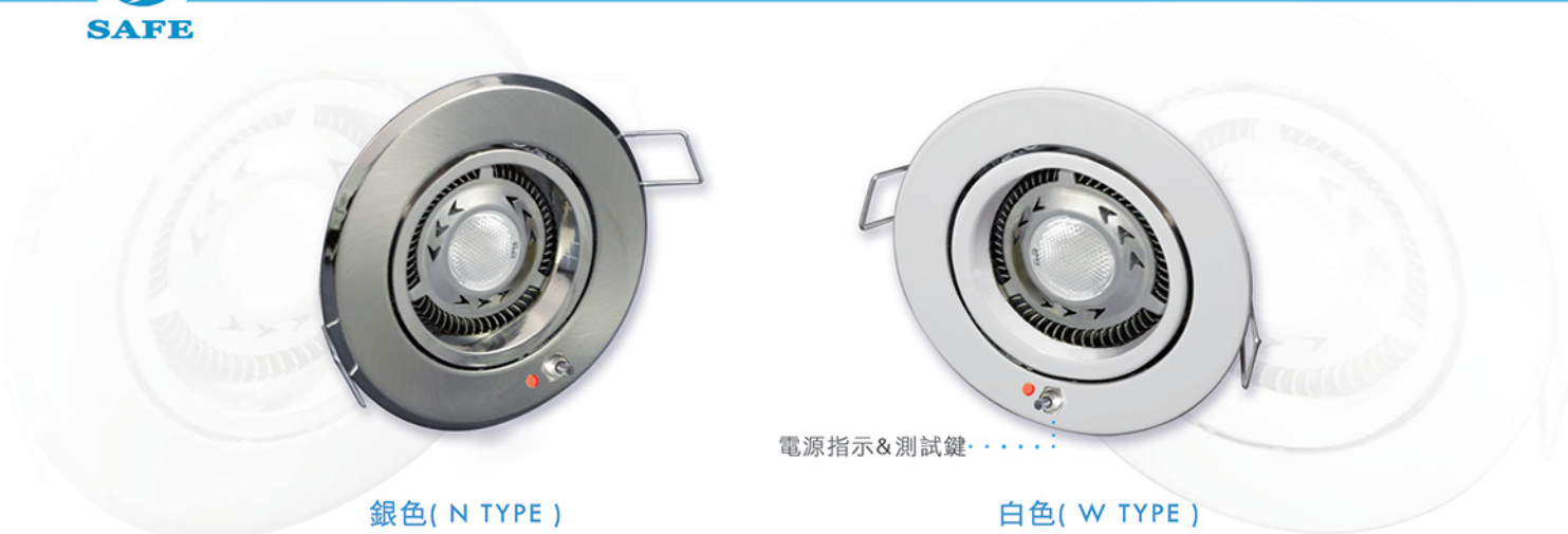
銀色( N TYPE )