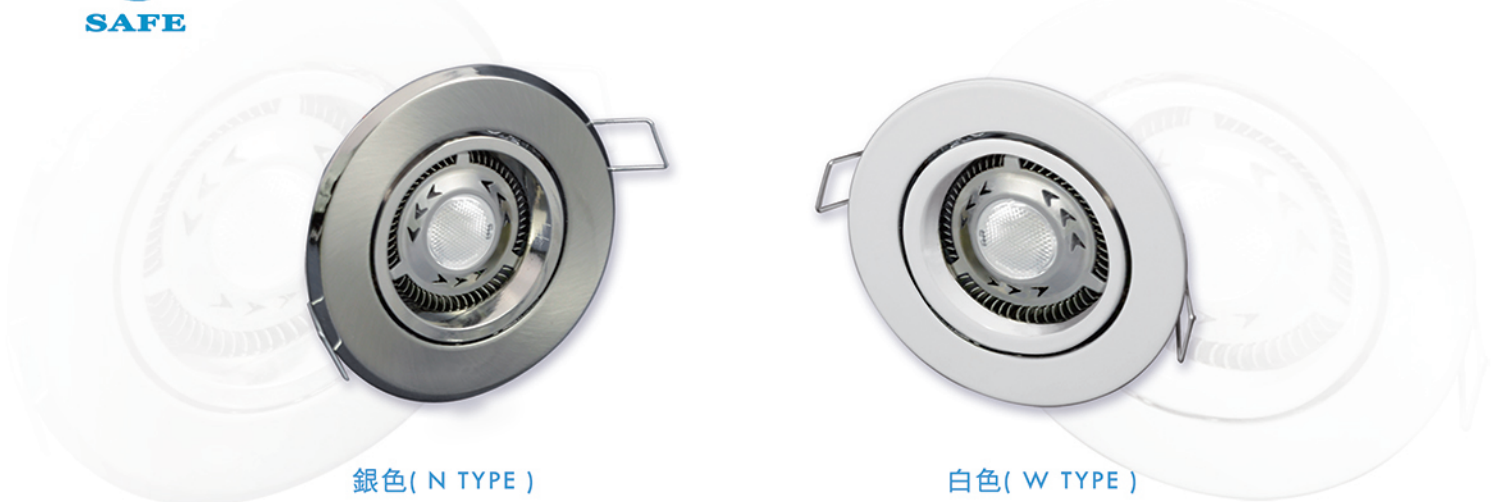
銀色( N TYPE )