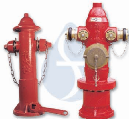
地上消防栓 HG-G1 HG-G2