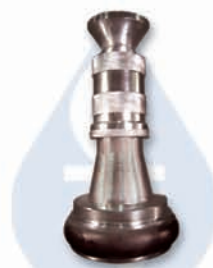
HN-1A/HN-1 1 1/2" HN-2A/HN-2 2 1/2"