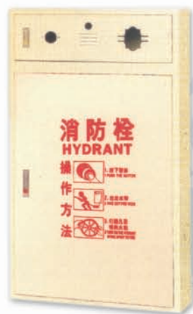
綜合消防栓箱 明/暗 HB-1 / HB-2 HB-3 / HB-4