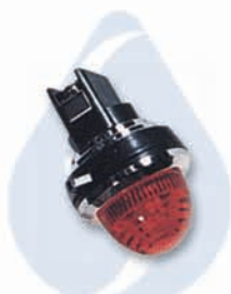
幫浦指示燈/緊急指示燈 SP-L