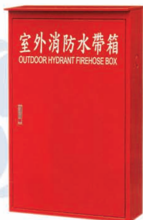
水帶箱 明/暗 HB-5 / HB-6